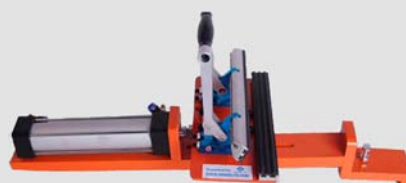
Pinza neumática de pistón corto o largo para montaje de mesa de entelado de pantalla grande, mediana o pequeña según requerimiento.