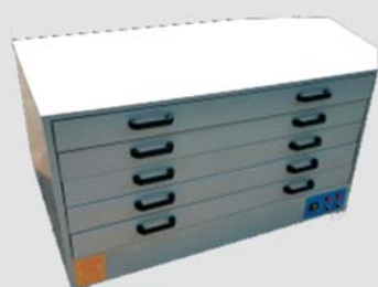
Horno de secado de pantallas serigráficas de 5 cajones con ventilador de recirculación del aire caliente

Impresión textil y fabricación de pantallas serigráficas