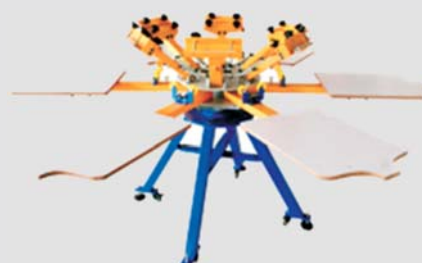
Pulpo de impresión textil manual de 6 colores

Recomendamos que los clientes hagan sus propias pruebas para evaluar si el producto satisface sus necesidades. It is always recommended that the customers do their own trials to evaluate if the product satisfy their needs. GLOBAL MANAGING S.L.U – POL. IND. MOGENT Av. Mogent, 40 08450 Llinars del Vallès (Barcelona) SPAIN – EU