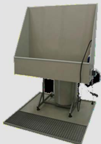
Pica de limpieza y revelado con opción de circuito de recirculación cerrado y/o luces de mampara blancas o amarillas