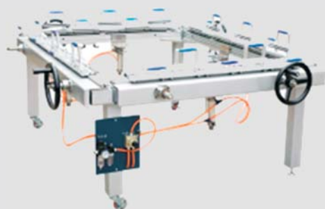
Mesa de entelado con sistema opcional de circuito de aire para facilitar el tensionado